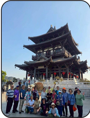
ตึกเซียวเหยา