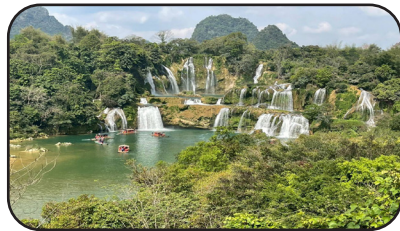
น้ำตกเต๋อเทียน