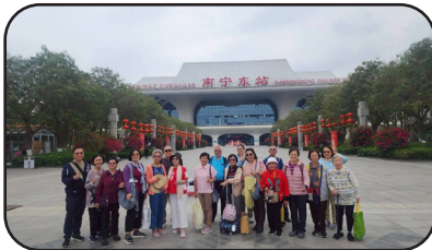
สถานีรถไฟหนานหนิง