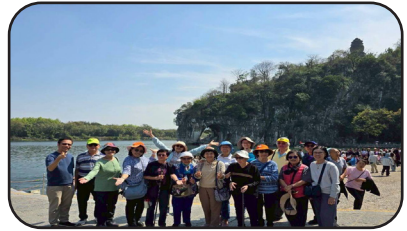
เขางวังช้าง