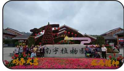
สวนสาธารณะชิงชิว