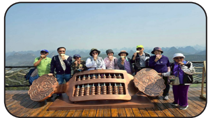
ผู้พิชิตยอดเขาหญูयी