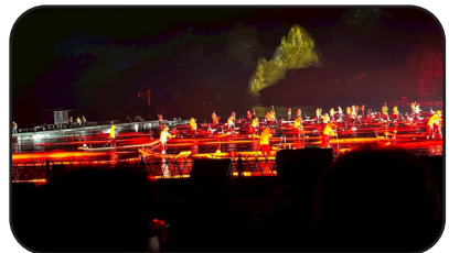
ชมการแสดงละครเพลง กำกับโดยจางอี้โหมว สุดอลังการ