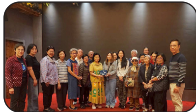
ขอบคุณไกด์เป่าเปาและเจ้าหน้าที่