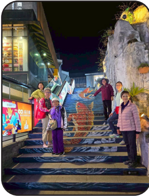
ถนนคนเดินยามค่ำคืน