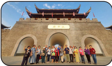
กำแพงเมืองโบราณไท่ผิง

ปลิวไม่ต้องลากกระเป๋าเองเลย ในรถบัสระหว่างไปสนามบิน น้องไกด์สองสาวกล่าวอำลาคู่สามีภรรยา ทั้งจริงคุณเปาเปาเป็นลูกศิษย์ จบคณะวิทยาศาสตร์ มศว จึงเหมือนได้ดูแลครูบาอาจารย์ มศว คิดในใจเชื่อว่าน้องทั้งสองนี่คงจะล้นมาก่อนเริ่มทริปเมื่อเห็นอายุเหล่าหมู่ 18 ตัวนี้ และก็คงจะใส่ใจมากที่ทุกอย่างผ่านไป ด้วยดี ไม่มีอุบัติเหตุใดๆ ไม่มีการเจ็บป่วยรุนแรงใดๆ สำหรับคุณน้องเจนี่ขอแนะนำว่า ไม่ควรฝึกพูดไทยให้ชัด เพราะการพูดไม่ชัดทำให้ลูกทัวร์หาได้ตลอด เช่น พูด “คออวย” เป็น “คอออย” (ฮามากกก) ไฟล์ชากลับใช้เวลาไม่นานก็ถึงสุวรรณภูมิโดยสวัสดิภาพ ดีใจถึงบ้านแล้ว แยกย้ายกันเดินทางกลับบ้าน เป็นอันจบนิทานเรื่องหมู่ 18 ตัวไปทัวร์จีน ขอให้ทุกท่านรักษาสุขภาพให้ดีเยี่ยม พร้อมสำหรับโปรแกรมเที่ยวครั้งต่อไป อ้อ ยังไม่ทันถึงบ้าน ก็มีสมาชิกถามถึงทริปครั้งต่อไปจะไปไหนดีน้อ (555) ท่านประธานตอบว่าพร้อมมากแต่ขอเวลาคิดก่อน ท่านใดมีข้อเสนอแนะหรืออยากเที่ยวจุดไหนก็แนะนำมาได้เลยค่า สำหรับวันนี้จ้ายเจี้ยน จู๋หนีไคว่เส่อ กานเปย (ลาก่อน ขอให้ท่านมีความสุข ชนแก้ว)