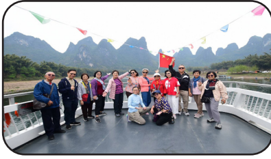
ล่องเรือแม่น้ำหลีเจียงขึ้นชมทัศนียภาพเขาหินปูน