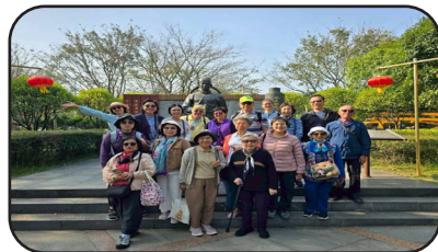
รวมถ่ายรูปหมู่ก่อนเข้าถ้ำลุยอ้อ