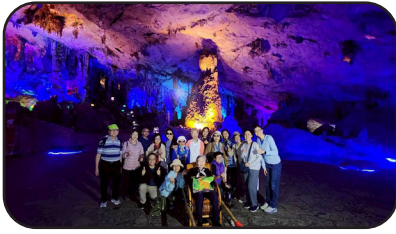
ภายในถ้ำขลุ่ยอ้อ