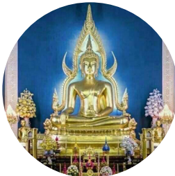
วัดเบญจมบพิตรดุสิตวนาราม