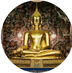
วัดสุทัศนเทพวราราม