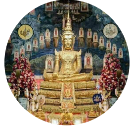
วัดปทุมคงคา