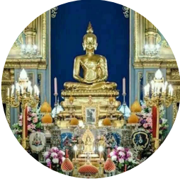
วัดราชบพิธสถิตมหาสีมาราม