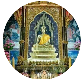
วัดโสมนัส