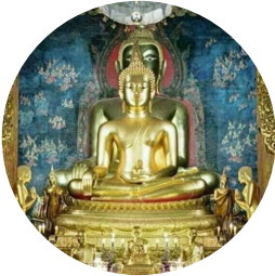
วัดบวรนิเวศวิหาร