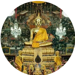
วัดอรุณราชวราราม