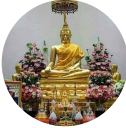
วัดพระราม 9 กาญจนาภิเษก