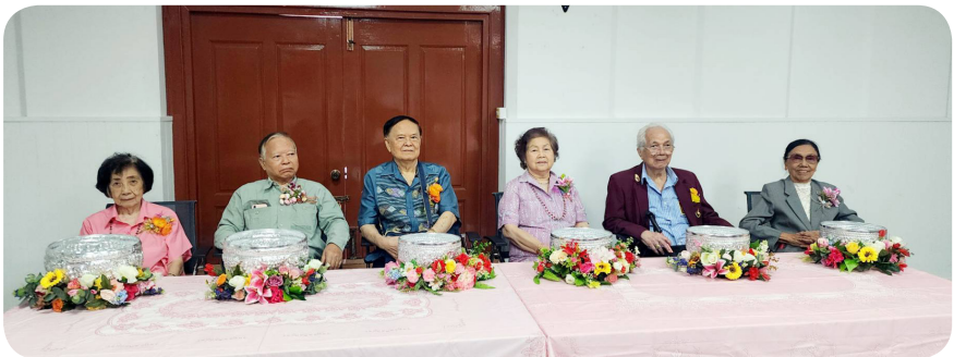
งานมุทิตาจิต 84 ปี (2567)