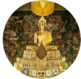
วัดพระเชตุพนวิมลมังคลาราม