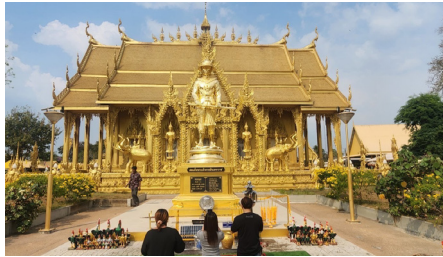
พระอุโบสถวัดปากน้ำโจ้โล้