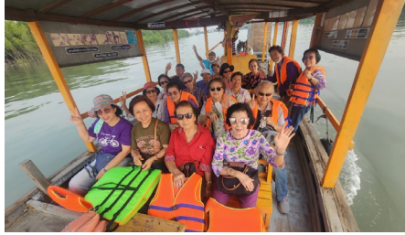
ล่องเรือชมสองฝั่งน้ำบางปะกง