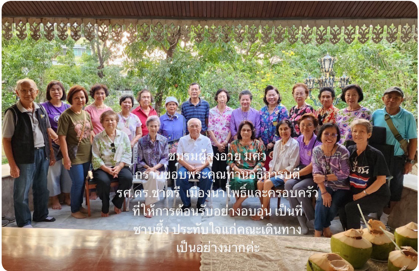
ชมรมผู้สูงอายุ มศว กราบขอขอบคุณท่านอธิการบดี รศ.ดร.ชาติรี เมืองนาโพธิ์และครอบครัว ที่ให้การต้อนรับอย่างอบอุ่น เป็นที่ ซาบซึ้ง ประทับใจแก่คณะเดินทาง เป็นอย่างมากค่ะ